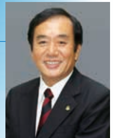
埼玉県知事 上田 清司

多くの県民、特に子供たちが広くスポーツに親しんでおり、スポーツ少年団員の数は日本一です。ラグビーワールドカップ2019に加え、2020年東京オリンピック・パラリンピックではバスケットボール、サッカー、ゴルフ、射撃の会場地となります。より本番に近い環境で事前トレーニングを行えるのが本県の強みです。私たち県民一同、皆様がベストコンディションで大会に臨めるよう心をこめてサポートしてまいりますので、是非とも埼玉へお越しください。