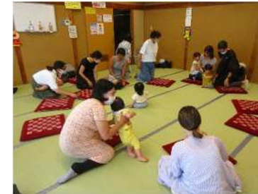
◀なごやかなサロン風景