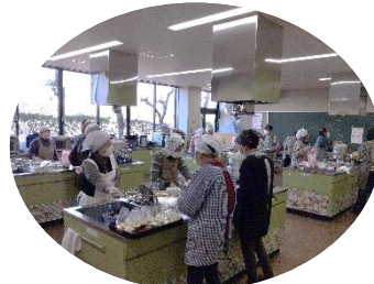
蒸しパンを作る母子愛育班の皆様