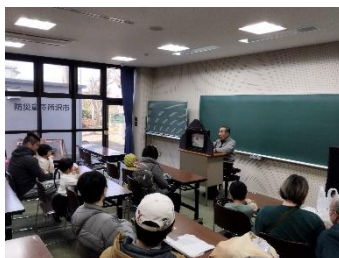
昔懐かしい紙芝居