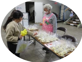
蒸しパンも子ども達に配布