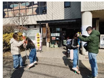
正面玄関では竹馬遊び