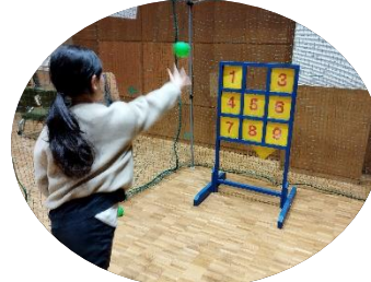
1番狙い！ストライクアウト