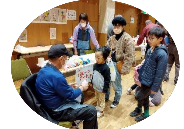
バルーンアート待っててね