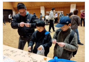
頭を使います！知恵の輪