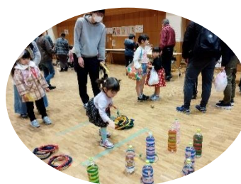
狙って、狙って！輪投げ