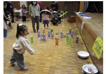
お手玉ポイポイたくさん入ったよ