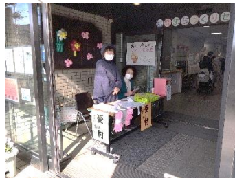
ようこそ！三世代まつりへ