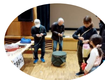
ママも一緒にコマ回し！