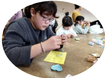
ビーズ作りに集中です！