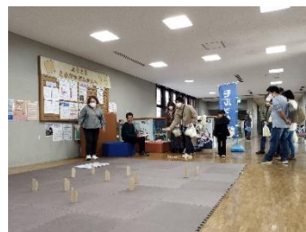
パパも真剣です！モルック