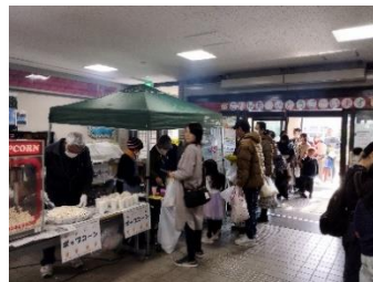
子ども達に人気の模擬店