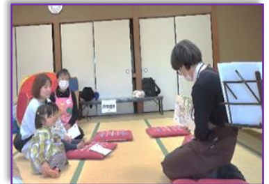
♥所沢図書館富岡分館職員の読み聞かせ♥

※奇数月は所沢図書館富岡分館・職員による読み聞かせ。10月はハロウィン、12月はクリスマス会のイベントがあります。 ※台風などにより、開催中止となる場合には、ほっとメール等で周知いたします。