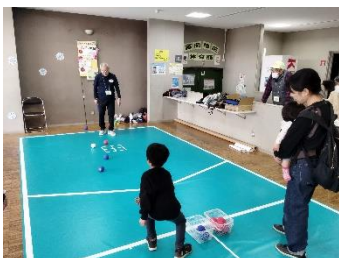
子ども達が上手い！ポッチャ