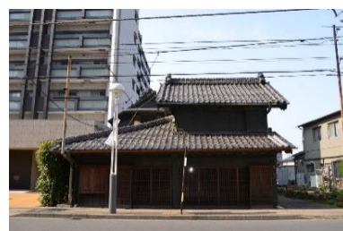
国登録有形文化財「秋田家住宅」