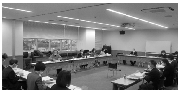
所沢市地域福祉推進委員会の様子