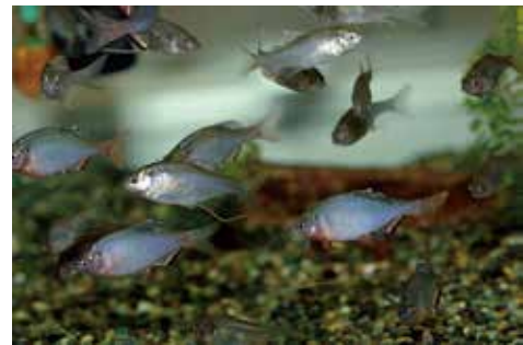
国の天然記念物 ミヤコタナゴ