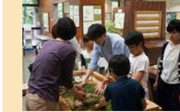
イベント手もみ茶づくり