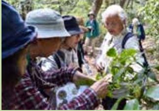
イベント自然観察会 ①

また毎月開催のイベントもあるので参加しよう！動植物や昆虫の観察をする自然観察会や地域に昔から伝わる文化を体験できる里山体験講座などがあるよ！