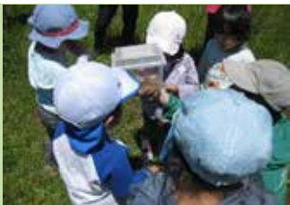
イベント自然観察会 ②