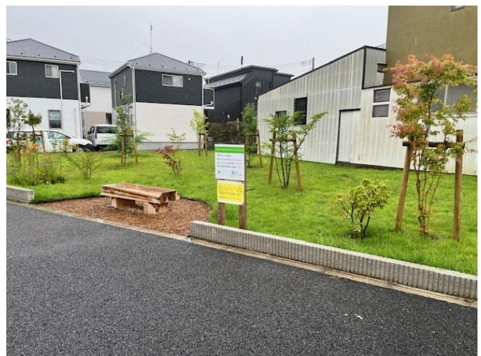
■みどりのエコスポット