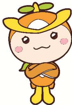
所沢市イメージマスコット トコロん