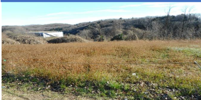
平成29年12月時点の農場整備前の様子