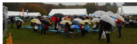
「ビンゴで賑わう会場」