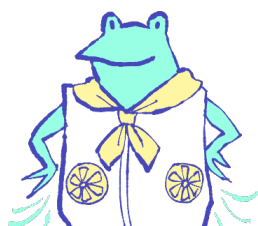
ファン付きウェア、 ネッククーラー