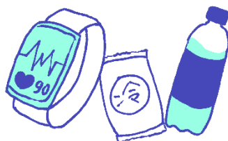
ウェアラブル端末、 応急セット