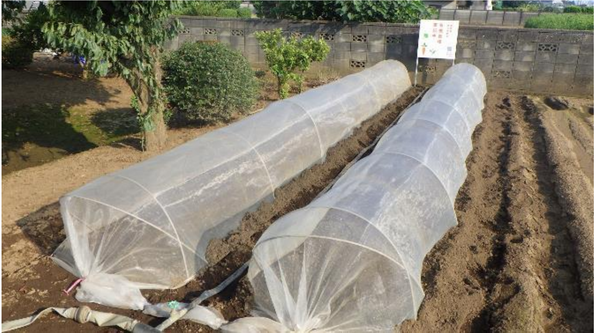
(播種後)防虫ネット設置