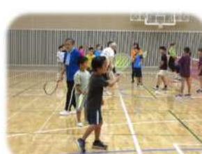
ミニテニス(8/20、21) 協力:ミニテニス優飛