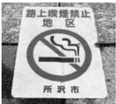
▲路上喫煙禁止マーク