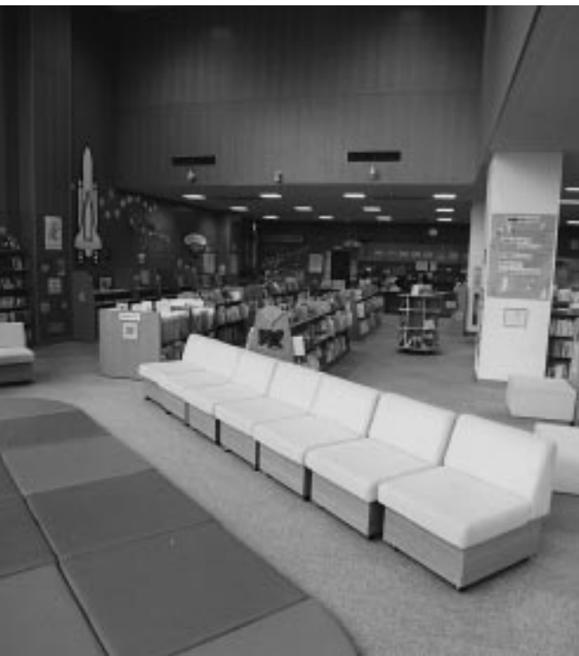
▲松井小学校図書館 (上安松)

教育長 小中学校におけるプール学習は、水に親しむ機会にもなることから大変有益であり多くの児童・生徒が楽しみにしている授業でもある。また、障害のある方や高齢の方にもご利用いただける全天候型の屋内プール設置の市民要望も多い。健康づくりとふれあいの場を提供する施設として整備を検討していきたい。