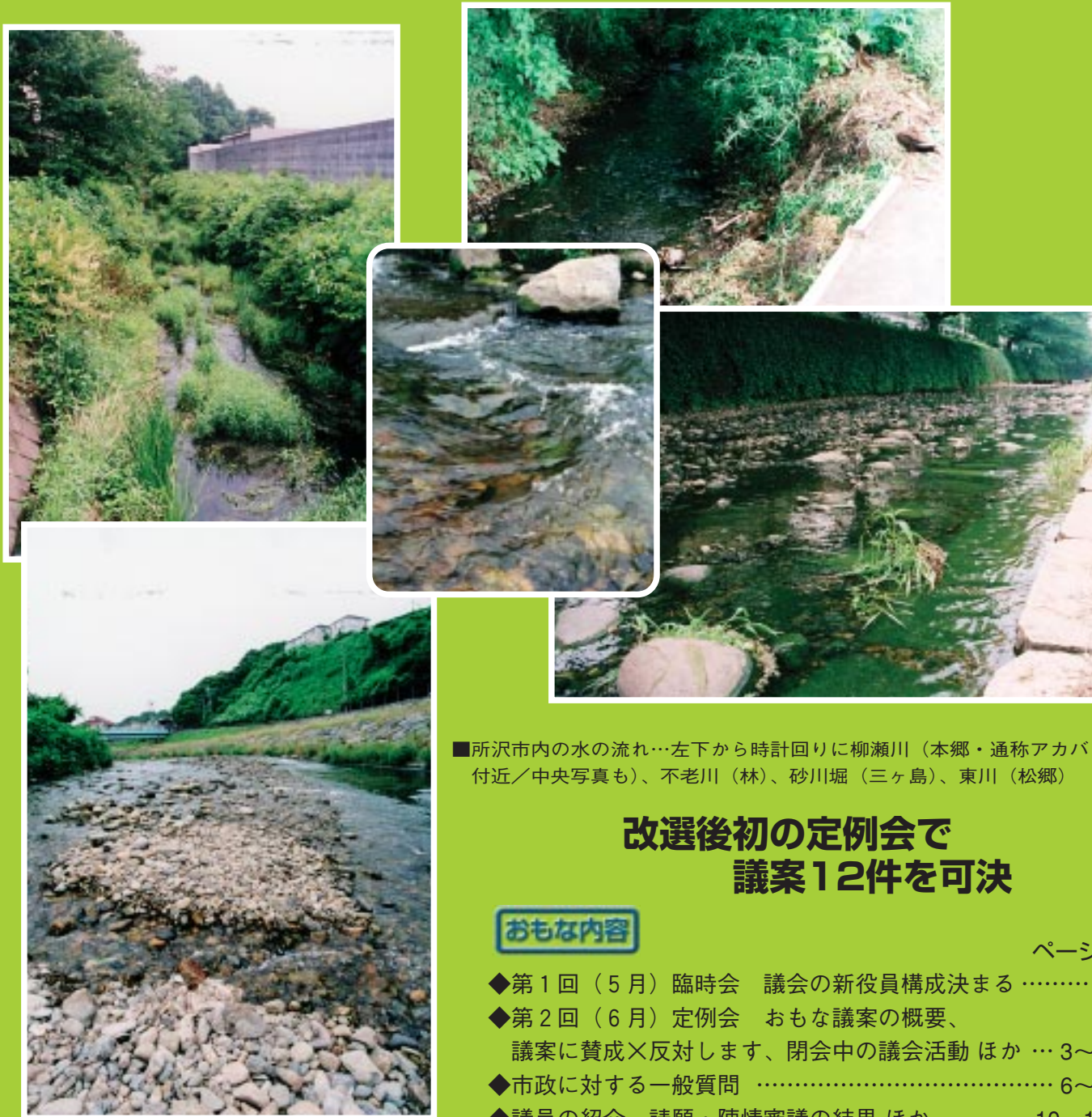
■所沢市内の水の流れ…左下から時計回りに柳瀬川(本郷・通称アカバッケ付近/中央写真も)、不老川(林)、砂川堀(三ヶ島)、東川(松郷)