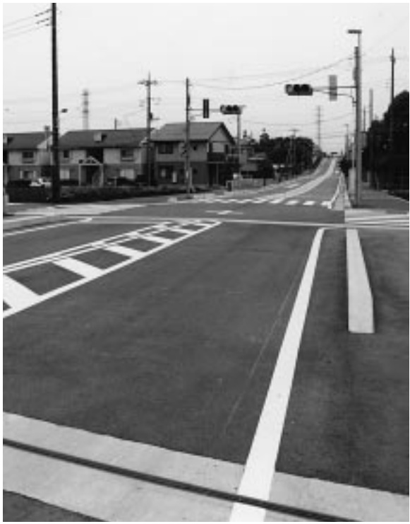
▲8月下旬に全線開通予定の北原安松線(牛沼付近)