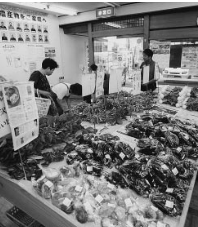
▲地産地消の拠点「とことこ市」(寿町)

議員 寿町地区の高層マンション計画により「とことこ市」が本年10月で閉鎖されるということだが、再び整備できないか。