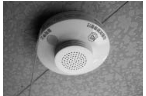
▲設置義務化された火災警報器

昨年に市内1、1000人を対象に住宅用火災警報器に関するアンケートを実施した。その結果、設置の義務付けを知っている人は72%、設置してあるという人は34%で、設置予定では、「すぐに」と「なるべく早く」を合わせて70%という結果だった。