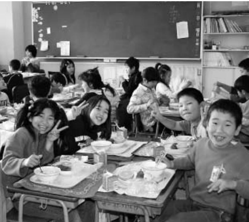
▲安心・安全な給食を子どもたちに

議員 月曜日に開館している自治体も増えているが、本市が月曜開館できない理由はなにか。 教育総務部長 図書館は、図書貸出、調査・研究、調べ学習など来館する方のさまざまな目的に配慮する施設である。そのため、月曜開館するためには、職員体制、専門職員の配置、電算システムの運用等さまざまな問題を解決していく必要がある。これを踏まえ、本館の月曜開館に係るコストを試算すると年間約5千万円以上の経費がかかる。また、現在新たな分館整備を進める中で、その機能や運営をどのように行っていくかという課題も抱えている。月曜開館については、今後図書館協議会等からも意見をいただき、サービスの向上にむけて検討していきたい。