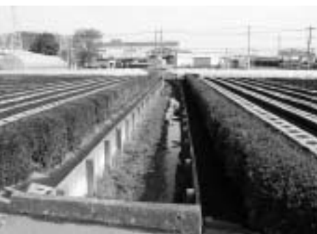
▲南永井地区を流れる唐沢堀