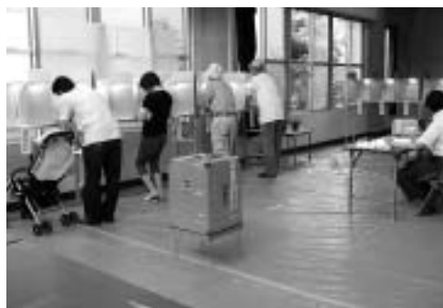
▲投票所のようなす

議員 高齢社会を支えるために、働きながら子どもを育てる若い世代に所沢に移り住んでもらうことが重要である。そのためには、地域経済をもっと活性化させ、地域内で安定した職業先の確保が欠かせない。所沢の商工労政を進展させるための考えを伺いたい。 市民経済部長 今後予想される人口減少や投資余力の減少といった