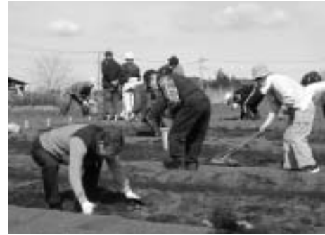
▲ふれあい農園（三ヶ島）

市民経済部長 平成17年にJAが三ヶ島地区に「ふれあい農園」を開園した。当初16区画だったが、50区画になっている。農業体験農園は、農業者にとっては、市場価