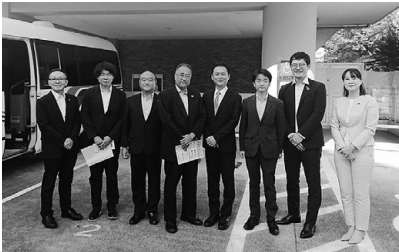
日野市エール発達・教育支援センター (東京都)