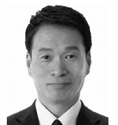
福原 浩昭 ⑤ 〔公明党〕