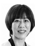
中井 めぐみ ① 〔日本共産党〕