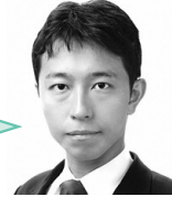
委員長 佐野 允彦 ② 〔自由民主党・維新・ 参政・無所属の会〕

2年目を迎え、より活動的に。島田副委員長と連携し、第3セクターや人事案件をはじめ、一切の付度のない厳しい審査を行ってまいります。