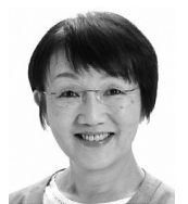
矢作 いづみ ⑥ 〔日本共産党〕