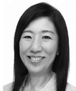
斉藤 かおり ① 〔自由民主党・維新・ 参政・無所属の会〕