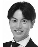
前田 浩昭① [自由民主党・維新・ 参政・無所属の会]