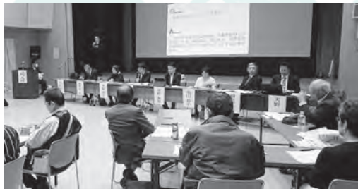
11月16日(土曜) 場所:山口まちづくりセンターホール