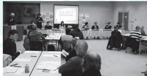
11月20日(水曜) 場所:所沢市役所全員協議会室