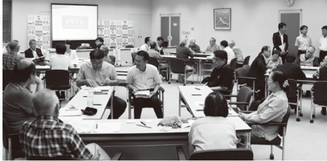
▲5月29日(水) 会場：所沢市役所全員協議室