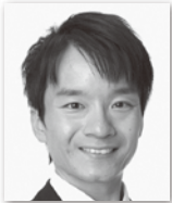
いしはら たかし 石原 昂② (自由民主党・無所属の会)