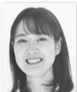
ながおかけいこ 長岡 恵子① (立憲民主党)