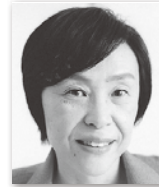
すえよし みほこ 末吉美帆子④ (立憲民主党)