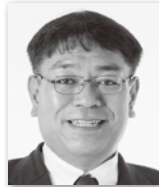
いしもとりょうぞう 石本 亮三④ (立憲民主党)