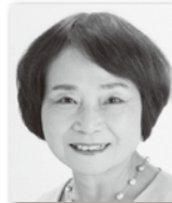
ひらいあけみ 平井明美⑨ (日本共産党)