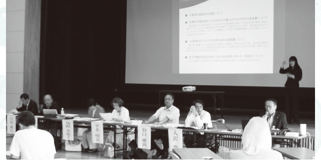
▲6月1日(土) 会場：三ヶ島まちづくりセンターホール