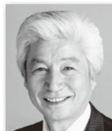
あらかわ ひろし 荒川 広⑩ (日本共産党)