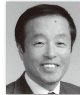
おおだちたかゆき 大館 隆行④ (自由民主党)