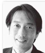
いりさわ ゆたか 入沢 豊③ (自由民主党・無所属の会)