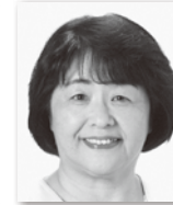
かめやまきょうこ 亀山恭子③ (公明党)