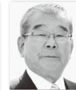
まつもとあきのぶ 松本明信③ (自由民主党)