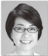
しろしたのりこ 城下 師子⑥ (日本共産党)