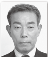
かすや ふじお 粕谷 不二夫② (自由民主党)