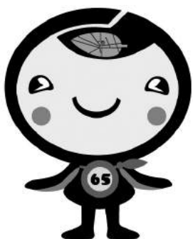
議員提出議案第 6 号