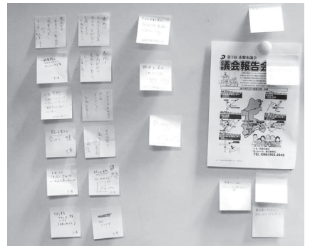
▲ 8 月 25 日開催、広聴広報委員会の様子（ふせん紙を使った課題等の抽出）