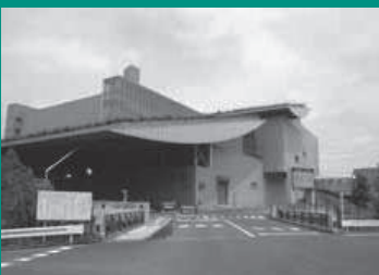
△東部クリーンセンター

●廃棄物の減量・資源の循環についての「所沢市東部クリーンセンターストックマネジメント計画の概要について」を審査しました。