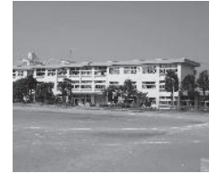
議案第 75 号

答 実証事業の結果データはなるべく細かく公表し、蓄電・蓄エネの参考となるようにするとともに、市での施設改修の際の参考とするなどして、設置の推進を図っていきたい。