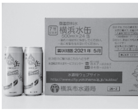
▲横浜市の水缶（横浜市HPより）

上下水道事業管理者 横浜市では製造原価と販売経費等を合わせると収益等はほとんど生じていないと聞いており、収益を目的とした水缶の製造販売については今のところ考えていない。災害時の飲料水という観点からの家庭の災害備蓄用の水缶については、危機管理部門の方針等もあるため、今後そういった部署と協議することになると考えている。