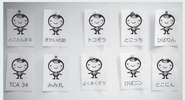
一次審査を通過した名前候補

議員数と同じ33の顔を持つキャラクターとして、また広聴広報委員会設置の目的の一つである「市民の声を聴く」ことの象徴として、これからさまざまな場面で活躍していきます!