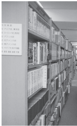
▲北海道幕別町の図書館

教育総務部長 二次元カラーコードについては、複数資料の一括認識や認識範囲の広さなど従来のバーコード等に見えない特徴を備えているが、防犯効果が見込めないことや導入している図書館が全国的に少ないことから、システムの完成度などを注視していく必要がある、現時点での導入は難しいと考えている。