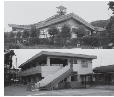
議案第 75 号

答 今年度は一律10灯を上限としたが、自治会によって所有灯数に違いがあるため、来年度は、現在行っている自治会等への意向調査や保有灯数等を配慮し、上限灯数等を考えていきたい。