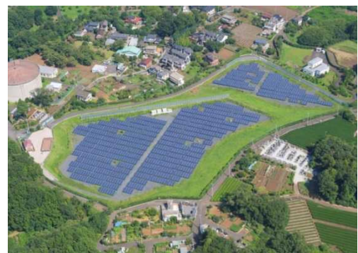
メガソーラー所沢 （愛称：とことこソーラー北野）

エネルギー・資源の大切さや地球温暖化対策への理解を促す環境教育や環境学習の取り組みを進め、これらの課題に関する市民意識の高揚を図ります。