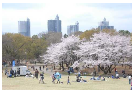
所沢航空記念公園の桜

また、私たちの日々の暮らしに潤いとやすらぎを与えてくれる街中のみどりを創出するため、公園の整備や道路・学校等の緑化のほか、みどりの街並みを形成する取り組みを推進します。