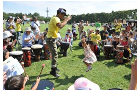
空飛ぶ音楽祭の1コマ