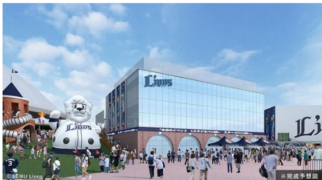
屋外子ども広場／オフィス棟