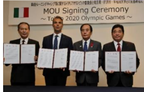
イタリアオリンピック委員会との覚書締結

今後は、定期的に日本代表(強化指定選手)による合宿や大会等が開催され本番に備えます。