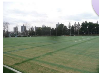
人工芝化工事中の多目的運動場

サッカー・ラグビー・フットサルなど、様々な競技で利用できるよう多目的運動場を人工芝化します。 今までできなかった夜間利用も可能になり、観客席、照明、クラブハウスも順次整備される予定です。