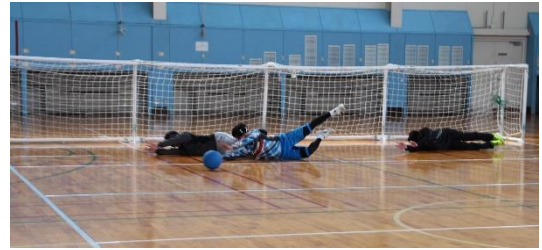
ゴールボールの試合