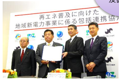
平成29年11月13日に協定を締結

化石燃料や原発に頼らない「再生可能エネルギー（バイオ・太陽光）」による電力の普及に向け、所沢市・JFEエンジニアリング(株)・飯能信用金庫・所沢商工会議所の4者で地域新電力会社を設立し、持続可能な社会の実現を目指します。 まずは、公共施設、次に市内事業者、ゆくゆくは一般家庭に。自分達を使う電気は自分達で責任を持つ、だから使い方にも気を配る。クリーンな地球を未来の子どもたちに。