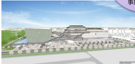
「ところざわサクラタウン」パース図