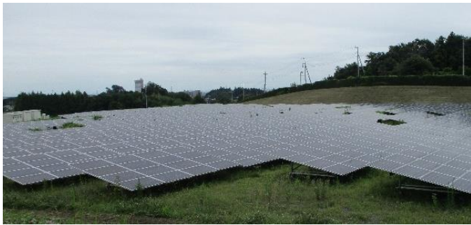
メガソーラー所沢 (とことこソーラー北野)