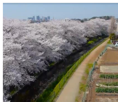
東川沿い