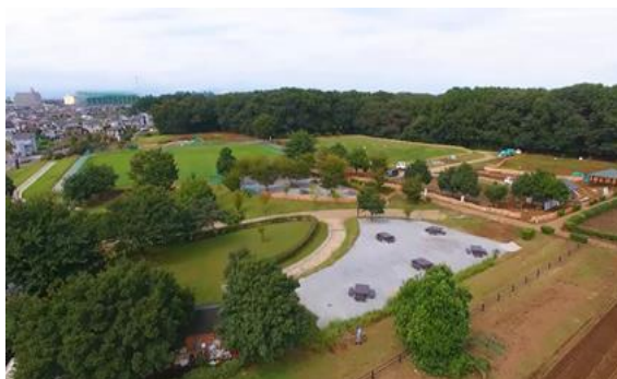
所沢カルチャーパーク