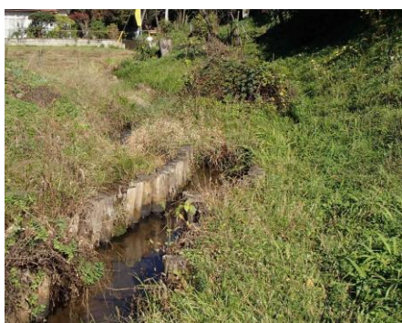
水辺のサポーターによる清掃活動をしている地区 (山口菩提樹現地水路)