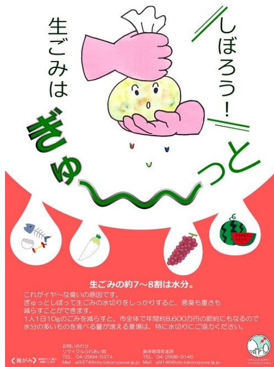
生ごみ減量に関する啓発ポスター