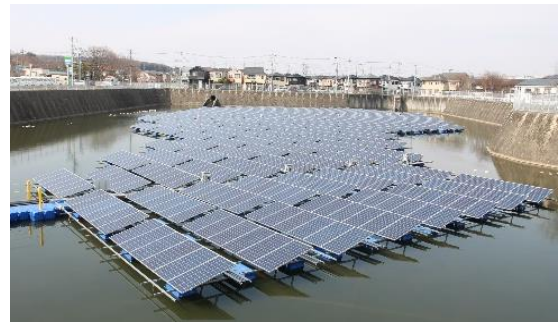
フロートソーラー所沢

メガソーラー所沢やフロートソーラー所沢の売電収入をマチエコ基金に積み立て、市民の皆様が、太陽光発電設備や省エネ設備を導入する際の経費の一部を助成したり、地域の道路照明灯や防犯灯のLED化に利用するなど、環境にやさしい取組に役立っています。