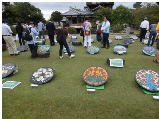
◀過去のマンホールサミットの様子▼

国内外の幅広い層に、日本が世界に誇れるクールなマンホール蓋の魅力を発信し、下水道事業のイメージアップと「事業の見える化」を推進します。