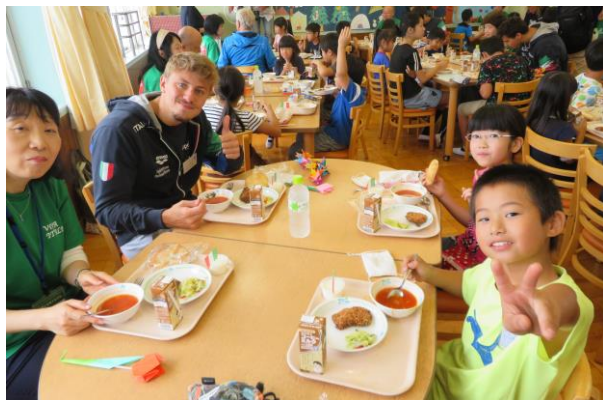
▲イタリア競泳チームとの交流

2021年7月6日(火)には、東京2020オリンピック競技大会の聖火リレーが所沢にやってきます。所沢市民体育館から所沢航空発祥記念館前芝生広場の全長2.4kmのコースをランナーが聖火をつないで走ります。