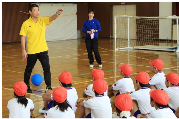
▲ゴールボール体験会