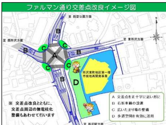
ファルマン通り交差点改良イメージ図

ファルマン通り交差点改良事業 P110 ファルマン通り交差点外無電柱化整備事業 P110