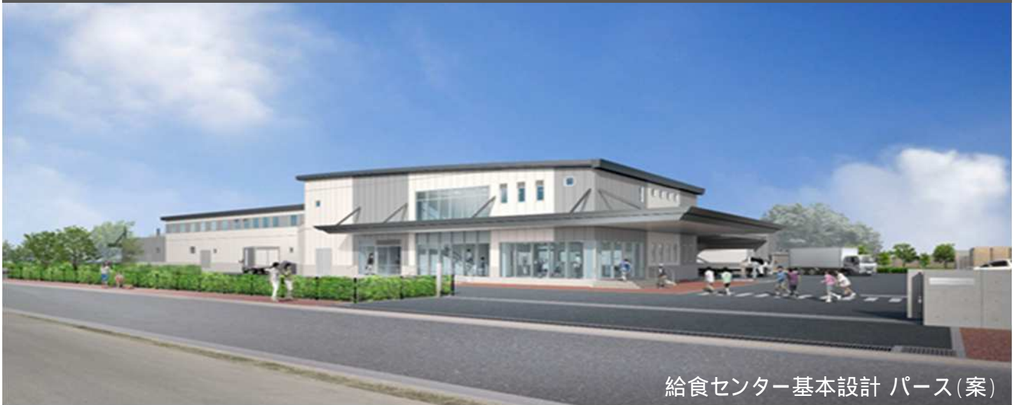
給食センター基本設計 パース(案)