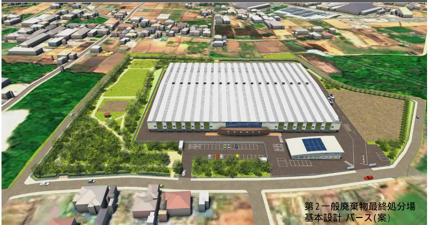
第2一般廃棄物最終処分場 基本設計 パース(案)