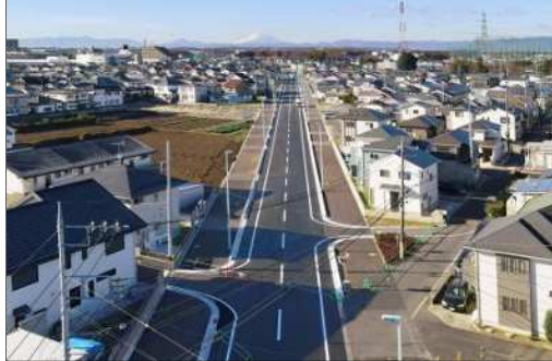
北野下富線道路築造事業 P114 松葉道北岩岡線道路築造事業 P114