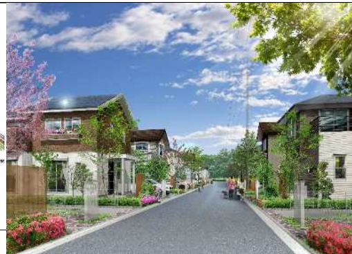
若松町地区 イメージパース図