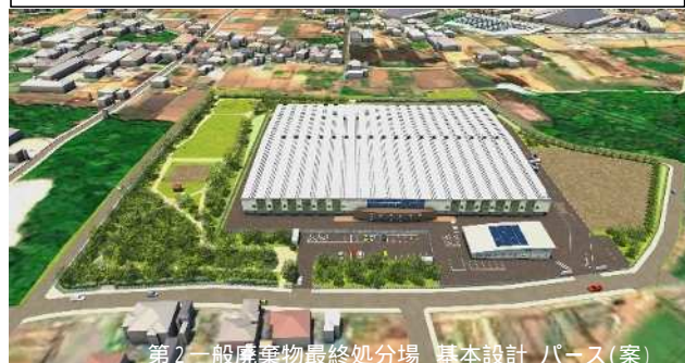
第2一般廃棄物最終処分場 基本設計 パース(案)