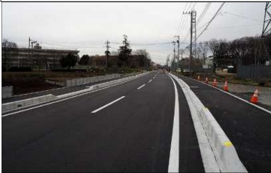
市道 4-1386 号線(上藤沢・林・宮寺間 新設道路 3 工区)築造事業 P114