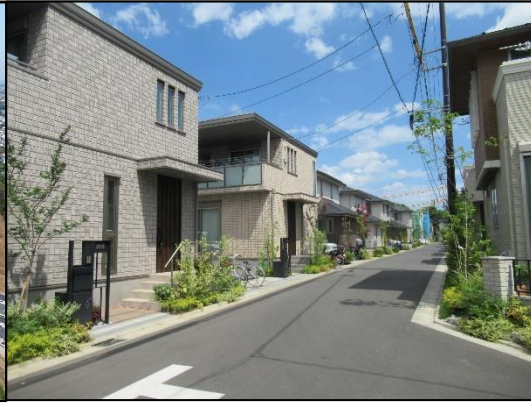
↑⑦北秋津・上安松地区