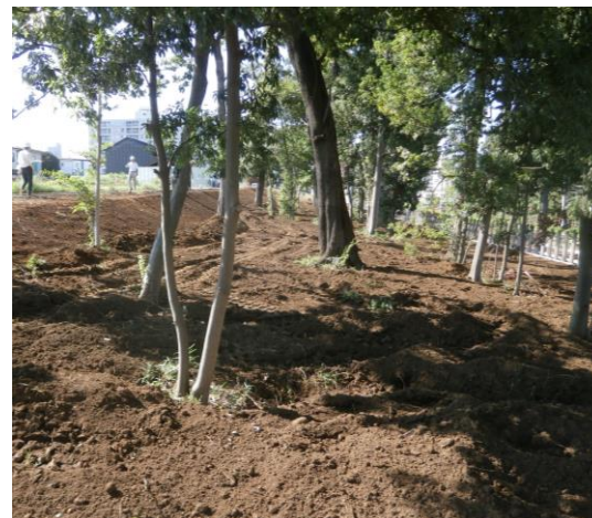
植樹予定地周辺の写真