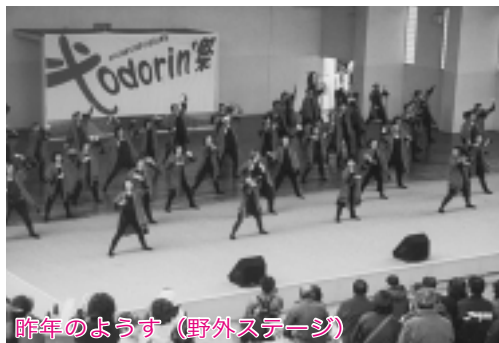
昨年のようなす(野外ステージ)