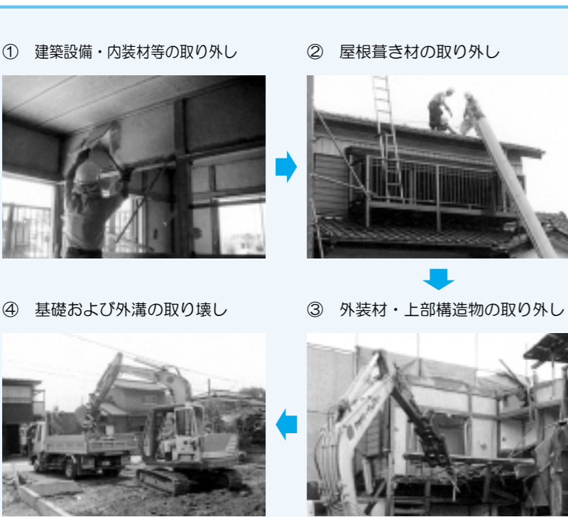
図1 分別解体の作業手順

暮らしやすく愛着の持てるまちづくりと、より良い環境の保全に向けて、市民の皆さんのご理解とご協力をいたしながら、引き続き努力してまいります。