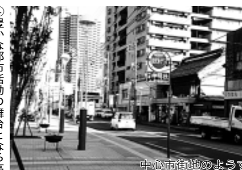
中心市街地のようす