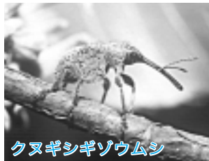
クヌギシギゾウムシ

この時期、雑木林の中を散策していると、コナラのまだ青いドングリが葉を付けたまま落ちて光景に出会います。風で枝が折れたのかと思えばよく見上げていると、風もないのにドングリが枝ごと落ちてくる不思議な現象に遭遇します。