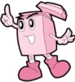
▲市のリサイクルキャラクター「リック」