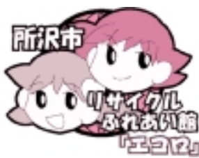
▲リサイクルふれあい館・エコロのイメージロゴ

詳しくは、お問い合わせください。 問い合わせ 国民年金課(☎998-9095・FAX998-9061)