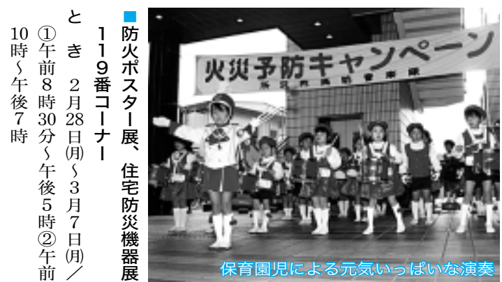
保育園児による元気いっぱいな演奏

皆さんのご家庭や隣近所でも、家の周りや人目につきやすい場所には燃えやすいものを置かないなど、地域ぐるみで放火されない環境(放火防止5つのポイントを参照)をつくるのが大切です。