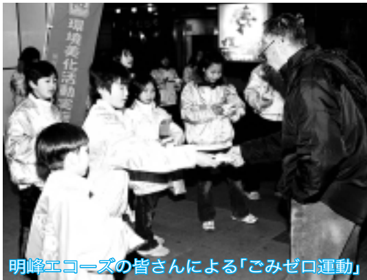
明峰エコースの皆さんによる「ごみゼロ運動」

現在、中級編に取り組んでいる「明峰エコース」の活動を紹介します。このグループでは、自分たちの学校とその周りのポイ捨てをなくしてきれいなまちにするための「ごみゼロ運動」を行っています。