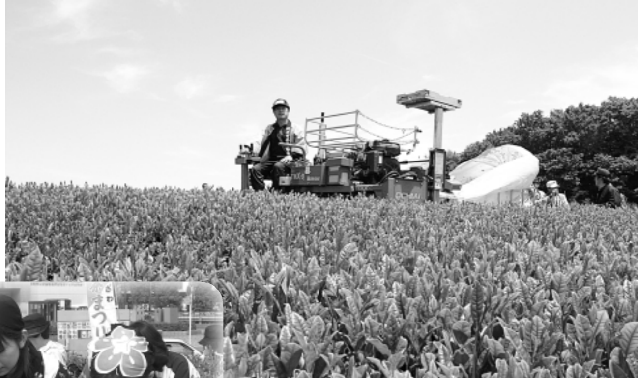
▶新茶まつりのようす

私たちの生活に溶け込んでいる「お茶」。所沢市は狭山茶の産地です。全国のお茶の主要な産地の市町村長が集う全国茶サミットを、市民文化センター・ミュージズおよび航空記念公園の一部を会場に開催します。 「茶葉からたしなむ日本の心」をテーマに、講演会などを通してお茶の魅力をご紹介します。 多くの皆さんのお越しをお待ちしています。ぜひ、お出かけください。 ※問い合わせ 全国茶サミット埼玉大会in所沢実行委員会事務局(農政課内) ☎2998-9158・FAX2998-9162