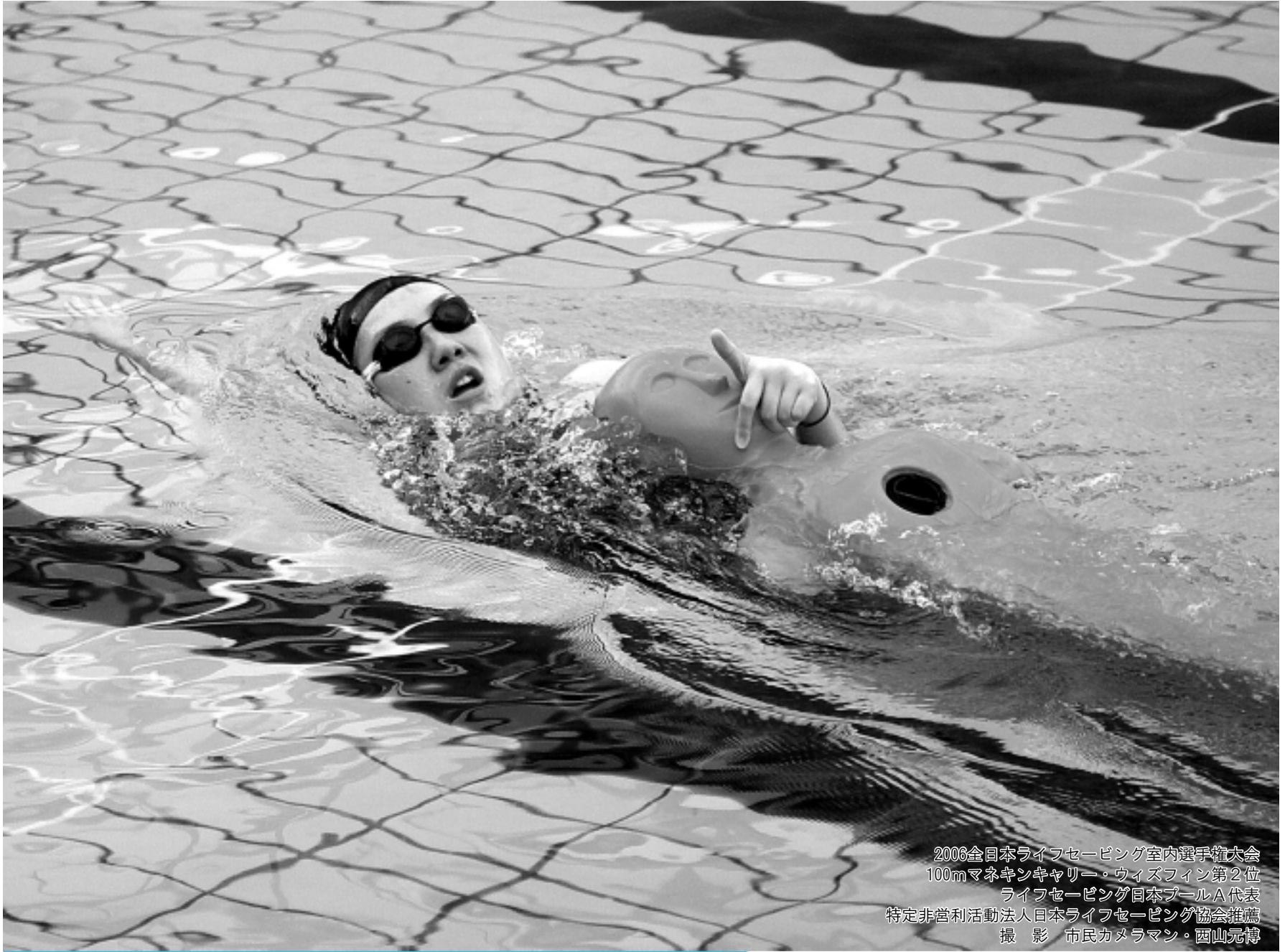
2006全日本ライフセービング室内選手権大会 100mマネキンキャリア・ウィズフィン第2位 ライフセービング日本プールA代表 特定非営利活動法人日本ライフセービング協会推薦