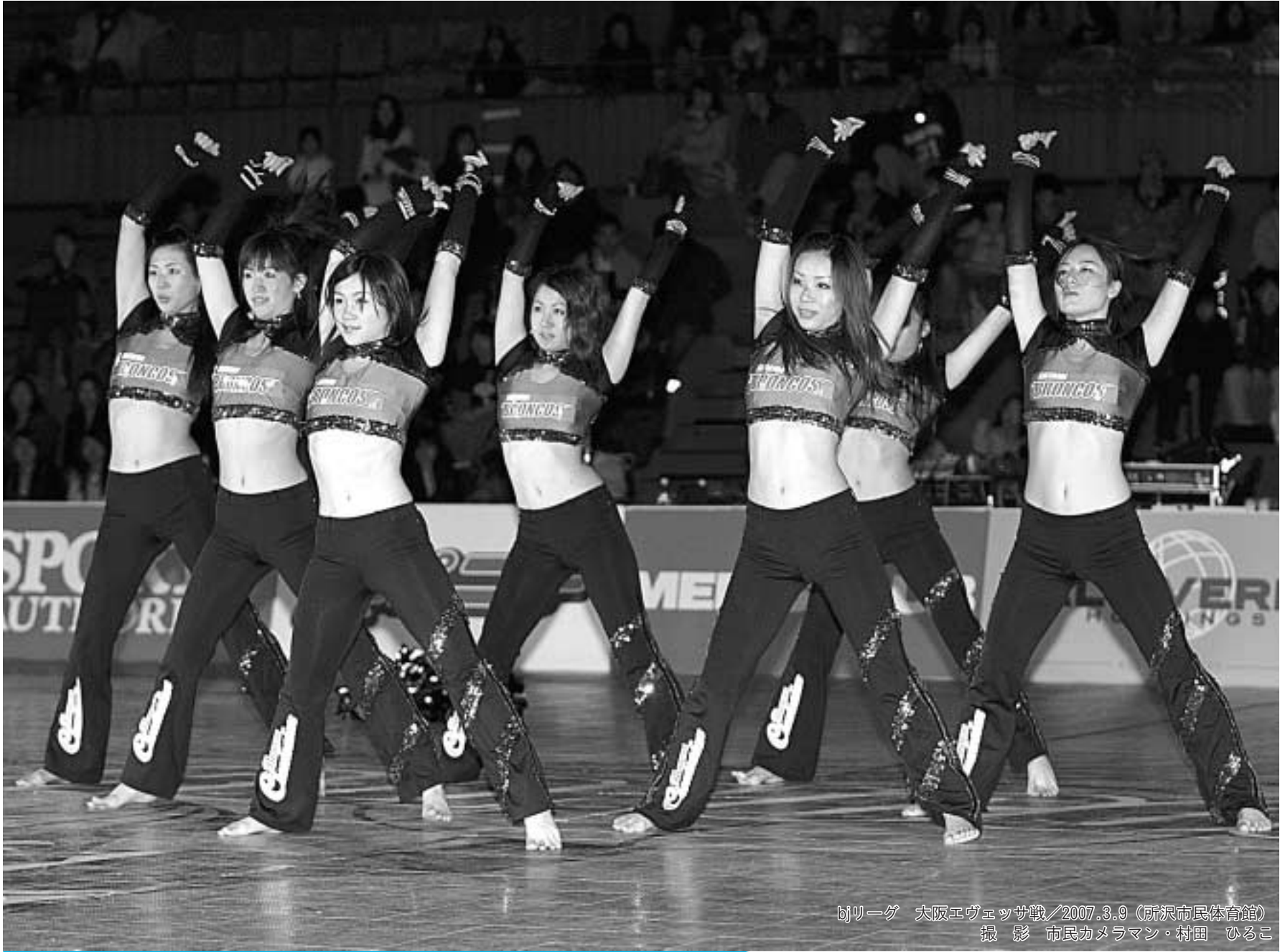
bjリーグ 大阪エヴェッサ戦/2007.3.9 (所沢市民体育館)