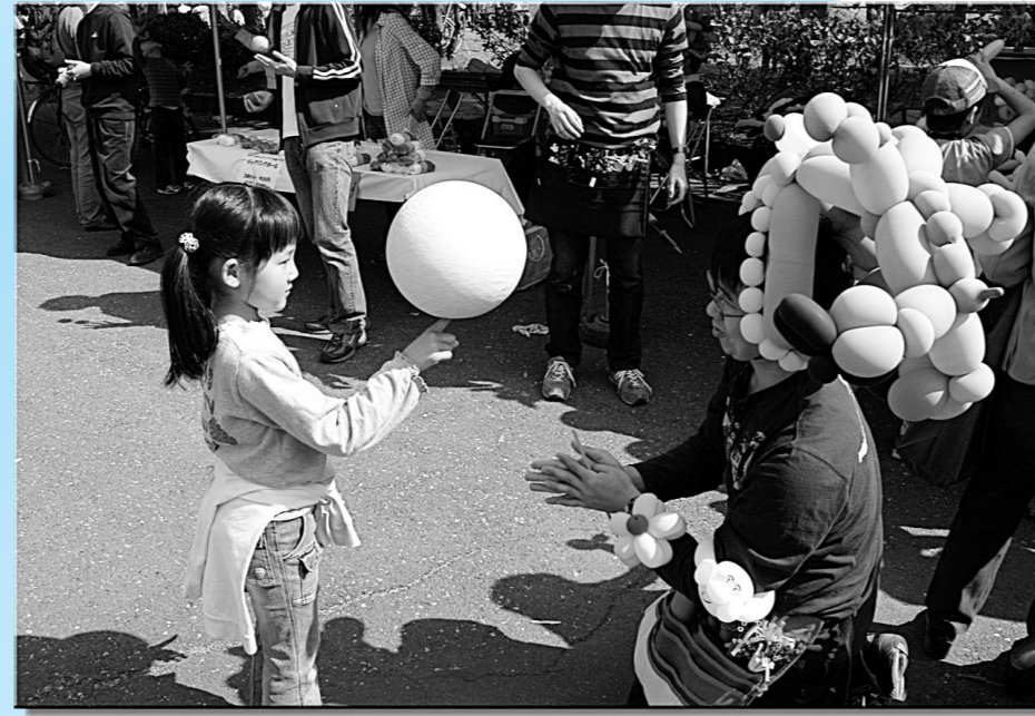
▲満開の桜の中で開催された「第23回市民文化フェア」。大勢の来場者でにぎわい、「ストリートパフォーマンス」のコーナーでは、女の子の指先でボールが回っていました。4月5日(土)・6日(日)/所沢航空記念公園