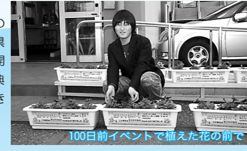
100日前イベントで植えた花の前で

県では高校生の人数が埼玉県より少なく、一人で何役もこなさ、仕事に責任を持って取り組んでいる姿を見て感動しました」と感想を話してくれました。インターハイ期間中は、暑さ対策が重要とのアドバイスを受け、検討しているそうです。 「生徒会の活動も、Kizuna活動も仲間の協力があってこそできるのです」また、「活動を通じて、普通に生活していたら出会えない仲間に出会えてよかった」と『絆』の大切さを力説します。 来県者を温かく迎え「気持ちよく競技ができ、充実した大会だった」と言われるように、頑張っていきたいと抱負をいただきました。 Kizuna活動で彩られた、熱くそしてさわやかな埼玉の夏がもうすぐ到来します。県内の高校生の協力によって開催される高校スポーツの祭典を皆さんもぜひ応援に行きましょう! (開催日程は表紙参照)