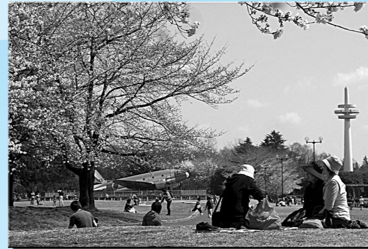
▲お弁当を広げて桜を楽しむ、春休みの小学生や女性グループなどが大勢いました。幸せな気分になりました。3月27日(木)/所沢航空記念公園(写真・文/松が丘・岡田 充)