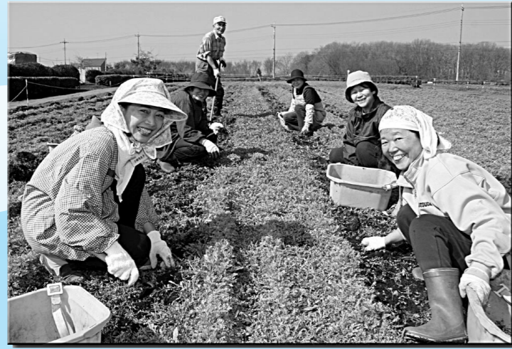
▲6月初旬ごろまで開花している北野のお花畑(4頁左下参照)。ボランティアの方々により整備が行われました。3月11日(火)/北野二丁目