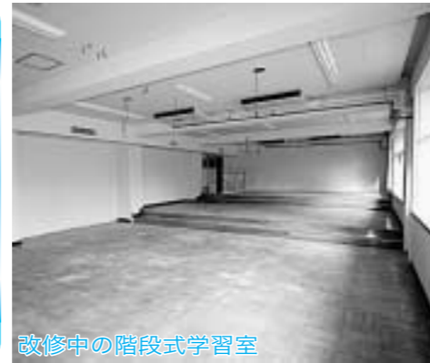
改修中の階段式学習室

生涯学習推進センターは、教育基本法第3条に掲げられた「生涯学習の理念」に基づき設置する施設です。