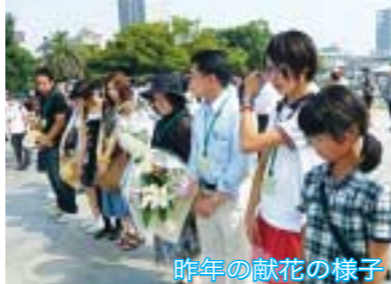
昨年の献花の様子

市では平和推進事業の一環として、8月6日(日)に広島市で開催される「広島市原爆死没者慰霊式並びに平和祈念式」に参加します。式典に所沢市平和大使として参加していただく中学生、高校生、大学生等を募集します。 ●募集期間 6月22日(月)～8月5日(日) / 6日(日)泊2日 ●内容 広島平和記念式典(広島市原爆死没者慰霊式並びに平和祈念式)への参加と原爆ドームや平和記念資料館等の見学 ●参加者は集合から解散まで団体行動をとっていただきます。また、感想文の提出等があります。 ●募集人数 6人(抽選) ●応募資格 市内在住で中学校、高校、専門学校、短大、大学等の