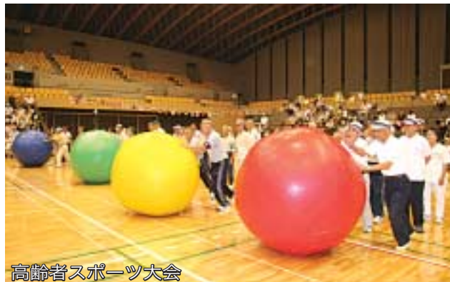
高齢者スポーツ大会