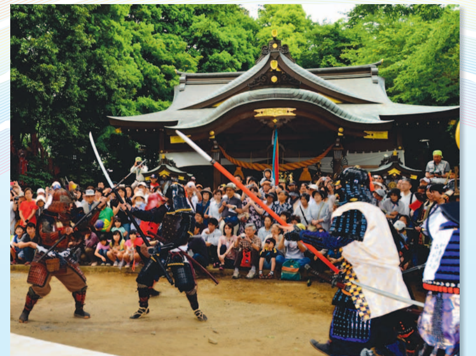
▶地域の財産である「滝の城跡」を多くの人に知ってもらうために開催された『第1回戦国滝の城まつり』。甲冑を身につけ、刀を交えた模擬合戦など、まるで戦国時代にタイムスリップしたようでした。5月20日(日)／滝の城址城山神社ほか