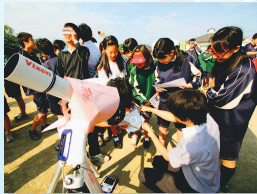
▲市立小・中学校で開催された『金環日食観察会』。午前7時35分ごろ、雲の切れ間から姿をあらわした太陽が月と重なり、リング状に輝きました。天体望遠鏡の太陽投影板や日食グラスを使って、その瞬間を観察した生徒たちから、大きな歓声が湧きました。5月21日(月)／向陽中学校