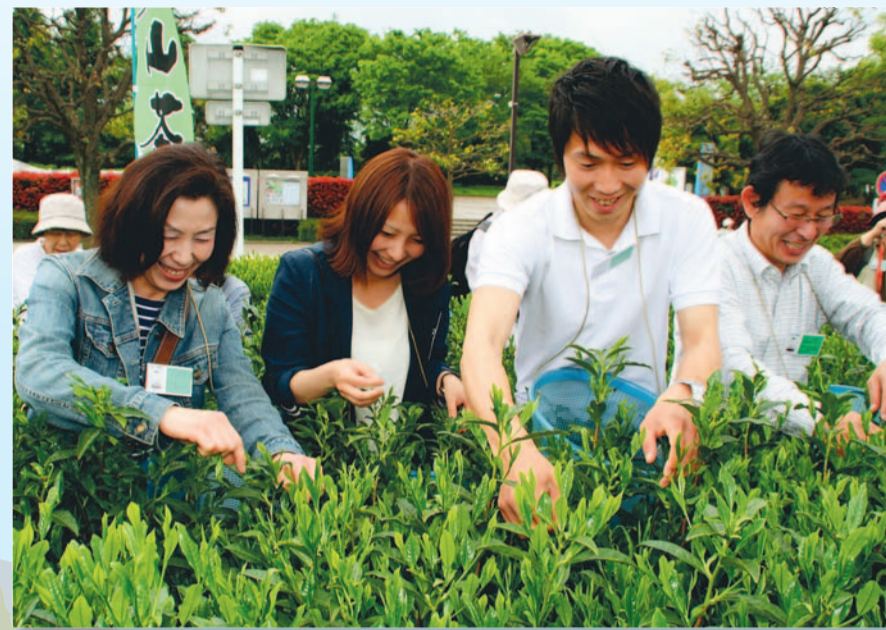
▲おいしい新茶の季節になり、市内の茶畑でも、鮮やかな緑色の新芽が元気に育っています。「ところざわ新茶まつり」では、航空公園駅前茶園で育てられている狭山茶「さやまかおり」の茶摘みを体験しました。5月1日(火)／航空公園駅前茶園