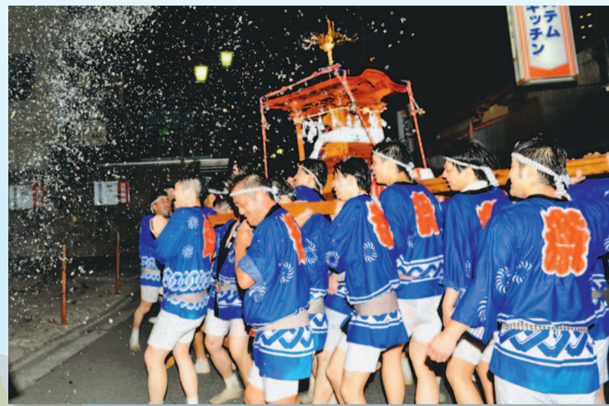
▲町内を巡ったみこしや神社境内での盆踊りで大いに盛り上がった『八雲神社天王様祭礼』。力強いみこし担ぎで暑さも吹き飛びました。 7月15日(日)/八雲神社(有楽町)