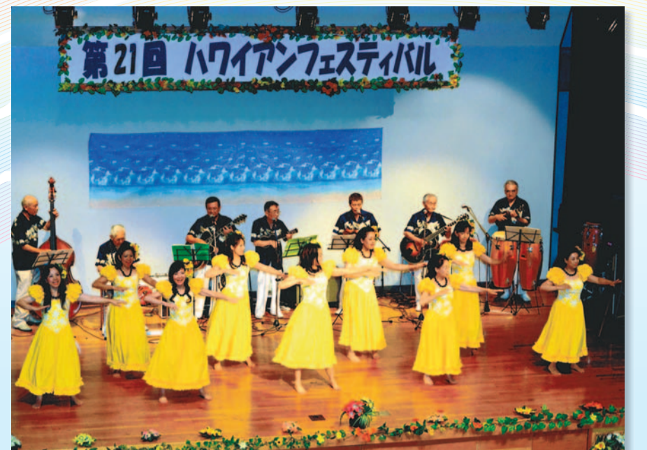
▲今回で21回目を迎えた『ハワイアンフェスティバル』。アマチュアバンドの心地よいリズムとあでやかな衣装を身にまとったフラダンスの熱演に満員の観客は拍手喝采でした。 7月1日(日)/吾妻まちづくりセンター