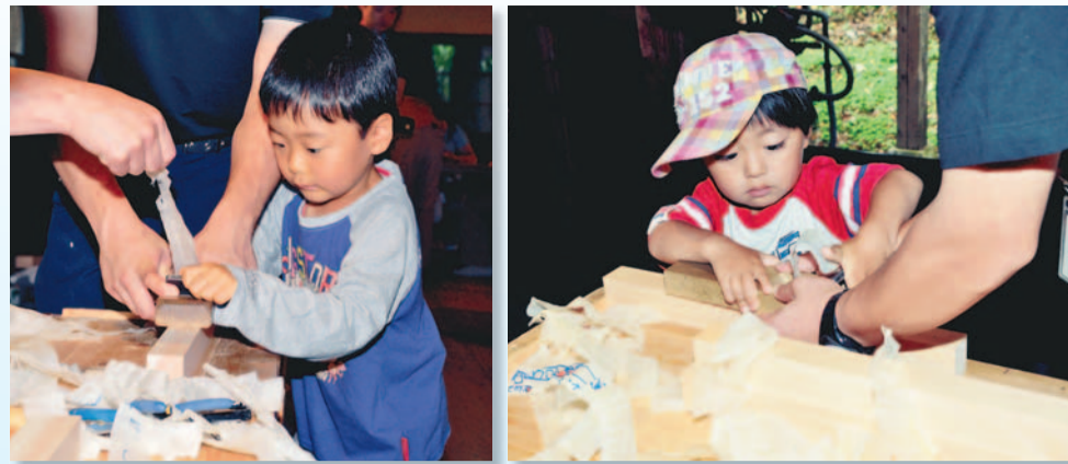
◀◀かんなで削りだした木の短冊で七夕飾りをした『木の短冊をつくって七夕飾りしよう!』。子どもたちは思い思いの願い事を短冊に書き、笹に飾りつけました。 7月7日(日)/クロスケの家(三ヶ島地区)