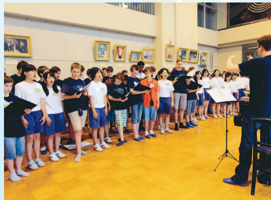
▲国際交流事業で来日したベルギー王立カンターテ・ドミノ少年合唱団が所沢中学校を訪問。同校混声合唱団との合唱は優しい天使の様な歌声でした。 7月5日(日)/所沢中学校