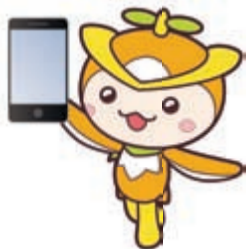
▲所沢市イメージマスコットころん