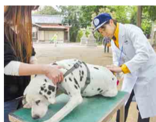
▲首輪や胸輪は抜かないようにし、特にひもは短く持ってください。

◆ 狂犬病予防注射の接種後4週間以上経過していない場合は、今回の狂犬病予防注射は受けられません。