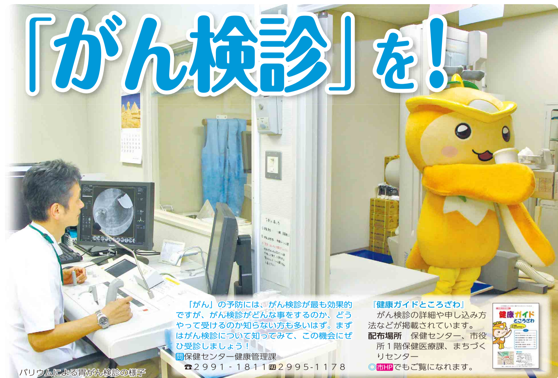
バリウムによる胃がん検診の様子

「がん」の予防には、がん検診が最も効果的ですが、がん検診がどんな事をするのか、どうやって受けるのか知らない方も多いため、まずはがん検診について知って、この機会にぜひ受診しましょう! ☎保健センター健康管理課 ☎2991-1811 ☎2995-1178