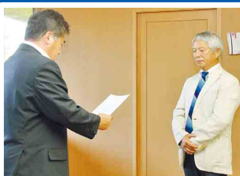
▲任命書交付式の様子