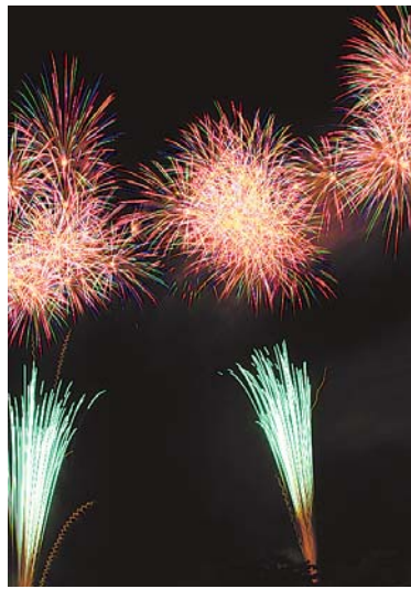
▼西武園ゆうえんちの花火大会が、8月6日(土)から始まりました。夜空に咲く大輪の花、はじける音。園内の見物席を埋め尽くした観客から大きな拍手と歓声が上がりました。