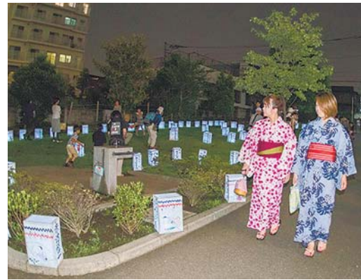
◀7月16日(土)、浴衣姿の人や、思い思いの仮装をした人などが夏の風情を楽しんだ野老澤行灯廊火。仮装パレードやミニ行灯づくり体験などのイベントに、子どもたちも大はしゃぎでした。